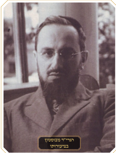
הגרי"ד מבוססין בציבורותו

הרב יצחק זילברשטיין בספרו 'קב ונקי' (סימן שנד) הביא תשובת הגרי"ש אלישיב על מעשה: "נכרי קטן שיהודים קנו אותו מידי גויים והטבילוהו ע"ד ב"ד, הילד לא יודע שהוא גר, וגם לא יודע שהוא מאומץ, והנה כתב ביש"ש דהא דמבואר בכתובות הגדילו אין יכולים למחות. היינו שנודע להם שגיירו אותם הבית דין, או אביהם, אבל אם היו קטנים מאד ולא זכרו דבר מהגיור ואחר כך כשהגדילו נודע להם הדבר, יכולים למחות אף אחר שנהגו דת יהודית כמה שנים כל זמן שלא ידעו מגירות, ועל פי זה הורו רבותיו שלפני הבר מצוה יודיעוהו שהוא גר קטן ויכול לפרוש מהיהדות אם רוצה, [ואז תתבטל למפרע יהדותו ויתברר שכל הזמן היה גוי], ויכול גם לקבל עליו כעת לקיים תורה ומצוות, ואז ישרא גר למפרע.