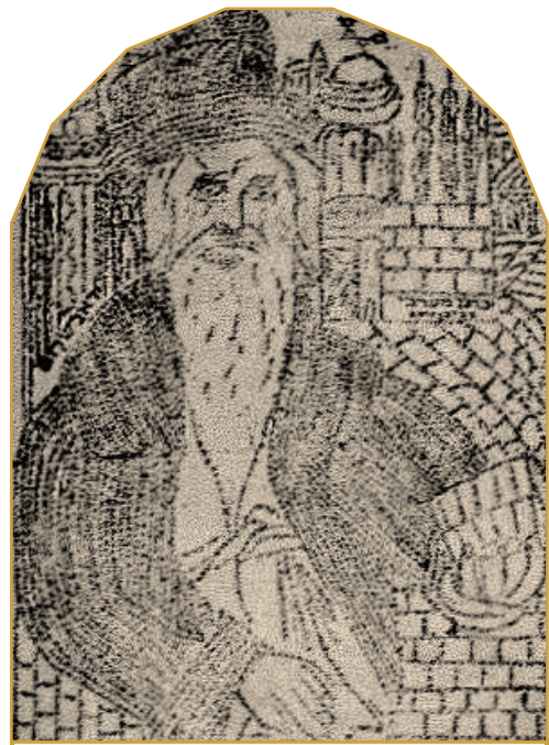
הדברי יחזקאל, בעת ביקורו בירושלים בתרכ"ט

ולשיטתו, החמיר על הכהנים, כי הוא סובר שהצדיקים שמתו על מיטתם יש להם טומאת מת.