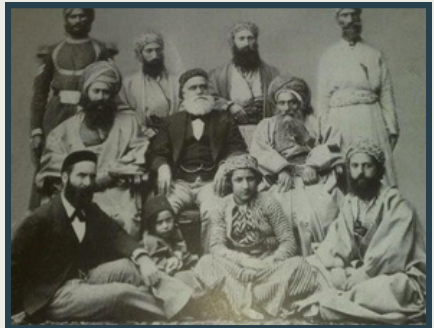
תמונה מיום ב"ח מנ"א תרל"ז, בנדאד. — מרן הבן איש חי בשורה האמצעית, ראשון משמאל

The poskim discuss what is the proper method of removing bones from fish on Shabbos: