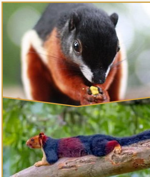
The Prevost's Squirrel The Malabar Squirrel

3) Divrei Dovid (the Turei Zahav's commentary to Rashi) suggests that the tachash of Yechezkel means