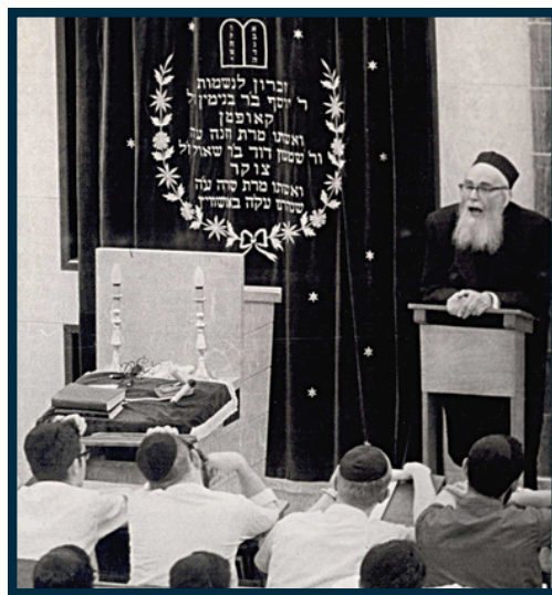
הגרסי"א בקול תורה תשל"ח

The second positive aspect of Shabbos observance is oneg Shabbos (literally enjoying the Shabbos). Halchikilly, one of the key applications of this is in the lighting of candles, which sets a peaceful ambiance and is an obligation for both men and women. One who is married may have their spouse light candles at home and say the blessing, which releases them from the obligation to light candles themselves. If one's family is not home or one does not have a spouse, it would be ideal to find a way to light in the hospital in a place such as an on-call room that is your private residence for eating and sleeping for the night.