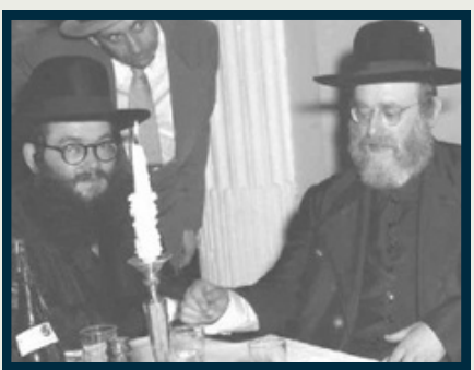
הבאר משה מדעברעצין בצגעריותו האם החטיב סופר

Chazon Ish[2] writes that tea leaves mixed into tea in a teapot can be separated by being poured through a slotted spout of the teapot.[3] Ketzos Hashulchan[4] and Rav Shlomo Zalman Auerbach[5] were lenient as well because they hold that any kli that is designated for immediate consumption after the borer isn't a kli borer. So too, the teapot is always used for borer before immediate consumption and is permitted. However, some poskim, including the Rav of Debreczin zt"l, disagree and maintain that one cannot use a teapot with a slotted spout.[6]