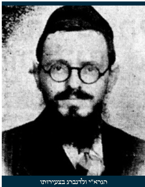
הגרא"ר ולדנברג בצעירותו

For those steeped in medical Halacha, IVF represents one of the most complex issues faced by halachic authorities in the past century. Rav Eliezer Waldenberg (Tzitz Eliezer 15:45) objected strongly to the entire procedure of IVF. He argued that the mitzvah of pru u'rvu (the commandment to procreate) could not be fulfilled through IVF, as there is no precedent in halachic sources for such fulfillment.