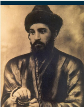
הגרא"ח נאה בעת שיהותו בבוכרה

The Rama [1] rules that if someone accidentally leaves money in their pocket before Shabbos, then they may walk with it in their pocket until they reach a safe place where they should then shake it out.