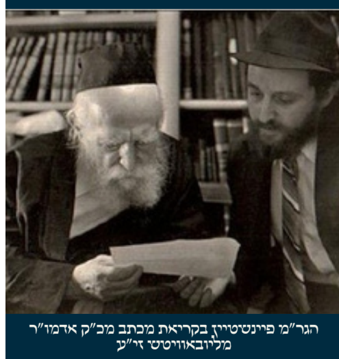
הגר"מ פיינשטיין בקריאת מכתב מכ"ק אדמו"ר מליובאוויטש זי"ע

ממון כמו כל אדם שהם בחזקת כשרות, ולא ניתנה תורה לשיעורים שכל אחד יאמר מי שרוצה, ולכן כל כח הנאמנות נתנה תורה לכל איש שסתמו הוא בחזקת כשרות כמו לצדיק וחסיד היותר גדול בעולם כמשה ואהרן, והצריכה דוקא שנים. אבל זהו רק מדין נאמנות שלא מכיר האיש וטבעו ומדותיו בעצם רק מצד חזקתו, אבל אם יודע ומכיר את האיש בעצם מצד טבעותיו ומנהגיו שניסוהו הרבה פעמים וראה שאינו משקר, אין זה מצד נאמנות אלא זהו ידענה וכראייה ממש וכו'. ואף שכתבו הר"ף והרמב"ם דבזה"א אין דנין דין קים ליה בגויה [לענין דיני ממונות, וכמבואר בכתובות דף פ"ה וא"ב אין להקל בנדון דידן מטעם קים