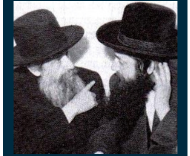
הסיבט הלוי אם הגר"י סרנא זצ"ל

אולם, אע"פ שדברי המומר נתקבלו אצל גדולי הפוסקים, מ"מ מדברי השו"ע הרב שאורח שחולק על זה [או עכ"פ על הבנתו של הדגול מרובה] שהרי הוא כתב בלפניו שבת (סימן שמו סעיף ג)