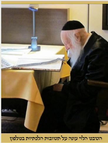
השבט הלוי עונה על תשובות הלכתיות בטלפון

אגב יש להניח הדברים, ההיתר הוא מוגבל מאד. כי לסברת הראשונים ההיתר הרי שייך רק אם כבר חזמינו לביתו כי אז מותר לכבדו, אבל לחזמינו לבתחילה לביתו אין לעשות.