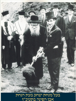
בעל מנחת יצחק בעית הנהגת אבן הפיפה בתש"ז

Rav Ovadia Yosef [Yalkut Yosef Issur V'Heter 3.89.80] rules that one only need have one sink, so long as they wash the meat and milk dishes separately. He reasons that an irui (stream of hot water) does not have the ability to cause food to become absorbed in the sink's walls. Furthermore, usually, one is not pouring boiling water directly on the keilim; and in addition, usually one is using soap while washing the dishes and soap causes everything to become pagum (ruined, i.e., not assur). Therefore, Rav Ovadia Yosef rules that one may wash meat and milk dishes one after another in the same sink.