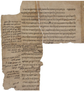
כתב יד קדשו של רבינו הרד"ב מגניזת קהיר

The question arises: why would Avram feel it is his responsibility, or even his right, to risk his life in such a dangerous situation? There is a tension between two ethical and Halachic values here: the responsibility to safeguard one's own life V'Nishmartem Me'od l'Nafshoteichem. On the other hand, the Gemara relates (Sanhedrin 73a) that the Torah commands lo ta'amod al dam re'echa—"do not stand idly by the blood of your neighbor"—imposing an obligation to intervene when another person is in peril. How do we reconcile these priorities, especially in high-risk contexts like those faced by security personnel or healthcare workers who, as part of their job, routinely put themselves in danger to save others?