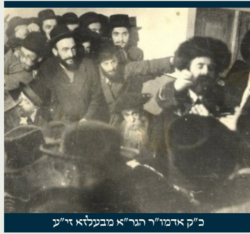
כ"ק אדמו"ר הגר"א מבעלזא ז"ל

והנה מוכח מהגמרא ומהפוסקים, שבזמן התלמוד היו מצויים ציידים כאלה, ואם כן מוכח שכל הכ"ד העופות הטמאים היו נמצאים בעולם הישן, מקום התנאים ואמוראים וחכמי התורה, זאת אומרת חצי כדור העולם המזרחי. והנה כשבאו לפני חמש מאות שנה בערך לעולם החדש, חצי הכדור המערבי, מצאו הרבה