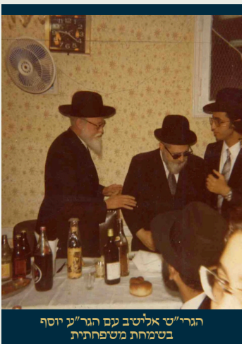
הגרי"ש אלישיב עם הגר"צ יוסף בטימרות מטיפחתית

Rav Elyashiv [2] (based on siman 308:7) explains that items thrown out before Shabbos are usually muktzeh. As long as it is normal to throw out the object as is, like in the case of a used disposable item, it is muktzeh once it was thrown out before Shabbos. [3] Rav Shlomo Zalman Auerbach [4] applies the same logic to food that is thrown into the garbage before Shabbos. He holds that such food is muktzeh because no one would take it out of the garbage, even to feed it to dogs. [5]